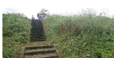
きれいになりました。

10/6 いよいよ「収穫祭」 しかし、残念ながら朝から小雨だ!!でも実行しました。参加のみなさんへ「ありがとうございました。」