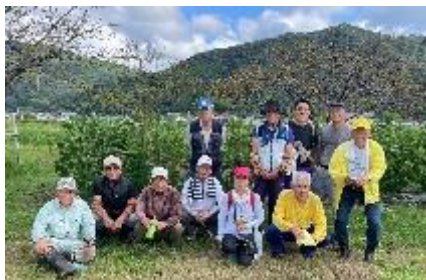
参加していただいた皆さん