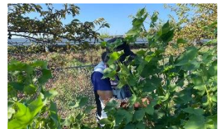
コットンに隠れて誰か？